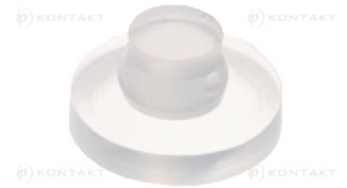
Typ 1 Type 1