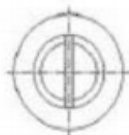
Typ 1 Type 1