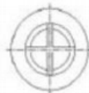
Typ 2 Type 2