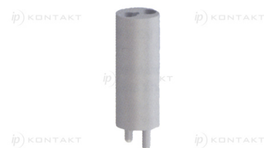
Otwory montażowe Mounting holes