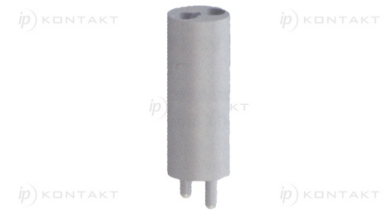
Otwory montażowe Mounting holes