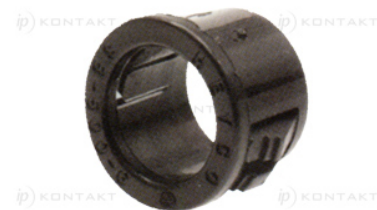
Typ 2 - wiele paneli Type 2 - multiple panel design