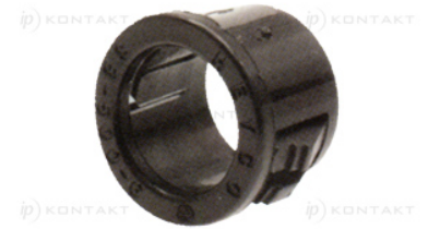
Typ 2 - wiele paneli Type 2 - multiple panel design